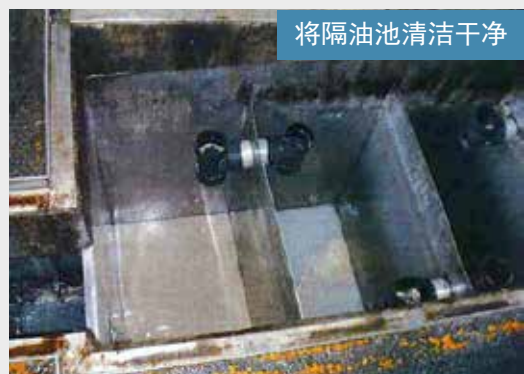
将隔油池清洁干净