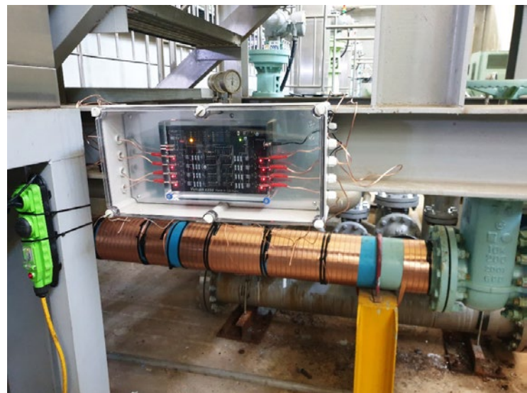
Vulcan S250安装在韩国水资源公司(K-water)

韩国水资源公司(K-water)已与Vulcan韩国团队的旧有客户联系，例如现代汽车公司(Hyundai Motor)和东丽工业公司(Toray Industries)。由于沃肯(Vulcan)在这些安装的良好成效，因此韩国水资源公司(K-water)决定采购Vulcan S250作为其防垢解决方案。