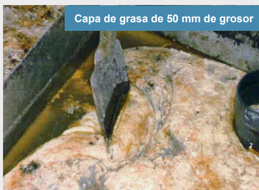
Capa de grasa de 50 mm de grosor