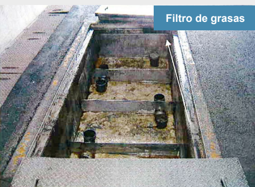
Filtro de grasas