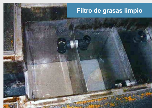
Filtro de grasas limpio