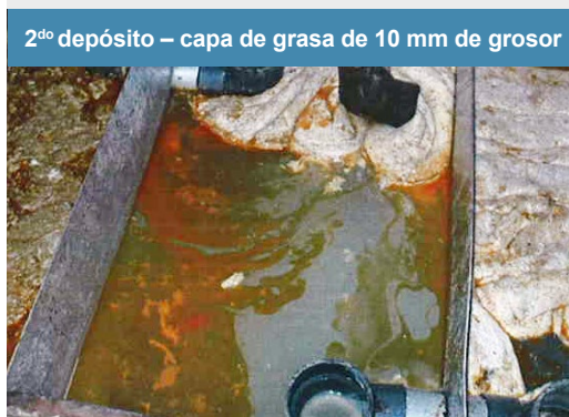
2º depósito – capa de grasa de 10 mm de grosor