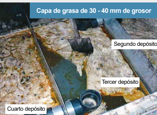
Capa de grasa de 30 - 40 mm de grosor