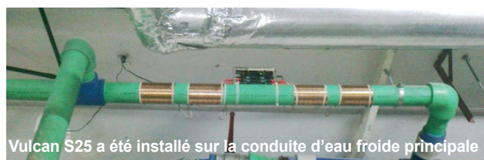
Vulcan S25 a été installé sur la conduite d'eau froide principale

L'île de Yas est l'une des destinations de voyage les plus passionnantes au monde.