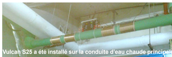
Vulcan S25 a été installé sur la conduite d'eau chaude principale