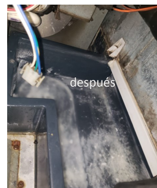
En algunas partes de maquina de hielo, la cal comenzó a desprenderse.

Luego de seis meses de uso, el gerente de mantenimiento tomó la decisión de adquirir el equipo dado los confiables resultados obtenidos. Desde que comenzó la prueba, ya no se utilizaron equipos tradicionales de ablandamiento de agua. Después de ocho meses (abril de 2023) de usar el Vulcan S25, las tuberías de vapor y el equipo del Spa tienen cal blanda que se elimina fácilmente con la mano. En año y medio, el Club ha ahorrado aproximadamente US$7.200 en sal.