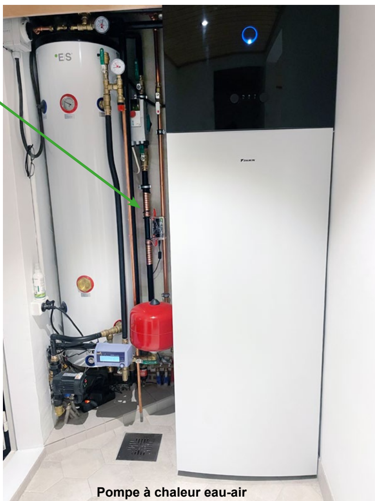
Pompe à chaleur eau-air