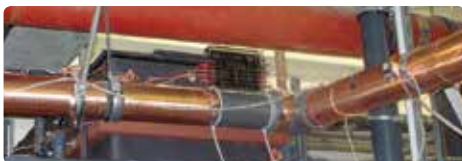
安装在圣·约瑟夫医院的Vulcan S250

“……几个月前，我们在医院内部安装了Vulcan S250，我们可以确认安装这项装置具有相当大的好处。像淋浴喷头这样的装置上，我们几乎看不到任何积垢，可以节省更换清洁设备的人力及成本花费。我们由衷地推荐由德国克里斯蒂水技术有限公司(CWT)安装的装置。”