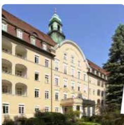
德国柏林圣·约瑟夫医院