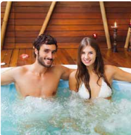
Bain bouillonnant d'une installation de bien-être