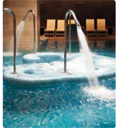
Piscine thermale à base d'eau de mer

Les piscines sont des systèmes en boucle semi-ouverts qui souffrent constamment des pertes d'eau à mesure que leur eau s'évapore. Les piscines demandent un entretien constant et nécessitent d'ajouter différents produits chimiques pour lutter contre les bactéries, les algues et conserver une bonne qualité d'air, conformément aux normes imposées. Vulcan améliore nettement la qualité de l'eau et renforce les propriétés de certaines substances.