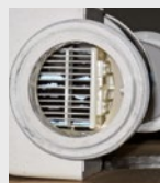
Filtri per piscine