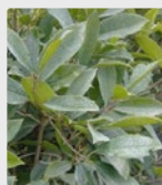
Piante e prato