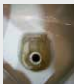
Cuvette de toilette