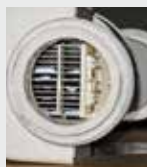
Filtere de piscine