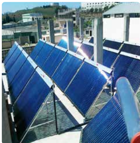
Panneaux chauffants solaires pour toitures d'appartements