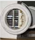
Filtere de piscine