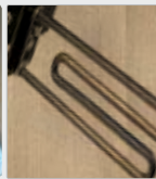
Elément de chauffage dans un réservoir d'eau chaude