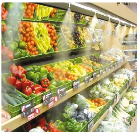
Nebulizzatori per frutta e verdura