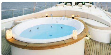
Una Jacuzzi sul ponte di uno yacht di lusso.