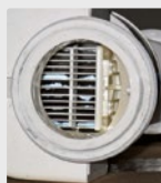
Filtri per piscine